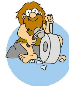
Prototipo Maker Invento